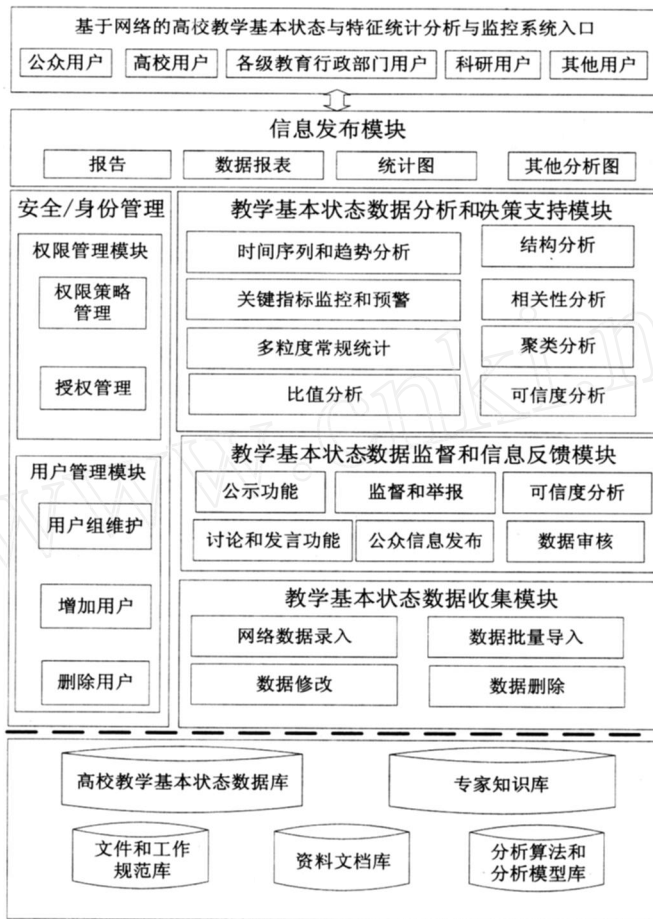
图2 教学基本状态数据库原型系统的功能架构框图